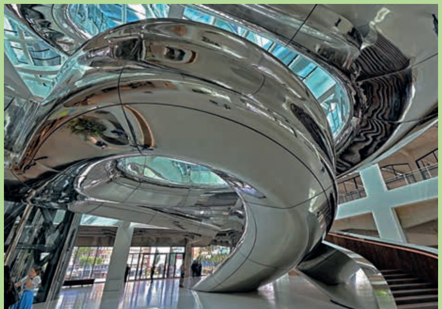
Phoenix Kunstmuseum Rotterdam.

Ik fotografeer nu met digitale full-frame systeemcamera's en vier hoogwaardige lenzen. Mijn focus ligt op landschappen, stadsgezichten en architectuur. Mijn donkere kamer heeft nu een plekje in mijn computer, waar ik elke opname 'ontwikkel' tot een perfect plaatje.'